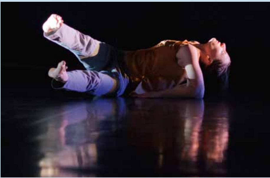
Sabine Glenz Double Bill